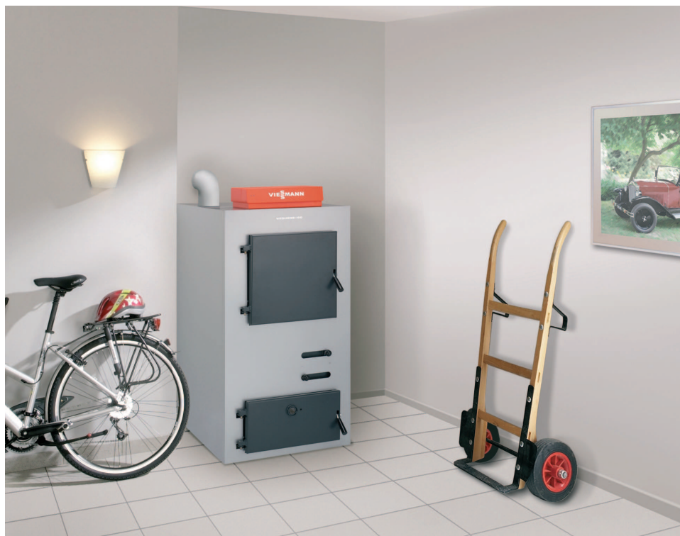
Зареждането с дърва на Vitoligno 100-S е лесно и удобно благодарение на широката врата от фронталната страна на котела

Пиролизната техника позволява високи коефициенти на ефективност при ниски стойности на отделените емисии. Големи, последователно свързани топлообменни повърхности в комбинация с вентилатора за отработените газове поддържат температурите на отделените газове ниски и допринасят за добро оползотворяване на горивото.